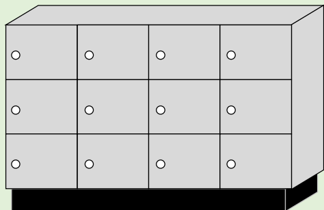
【C】複数ボックスタイプ(大型)